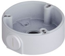
PFA135 Wasserfeste Anschlußbox